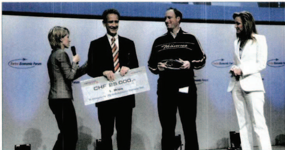
Den Gewinnern des Swiss Economic Award winken nicht nur finanzielle Preise, sondern viel ebenso wichtige Publizität.

in den Printmedien. Interessierte und erfolgreiche Jungunternehmen finden sämtliche Informationen zur Teilnahme unter www.swisseconomic.ch/award . Swiss Economic Forum 3645 Thun-Gwatt 0848 900 901