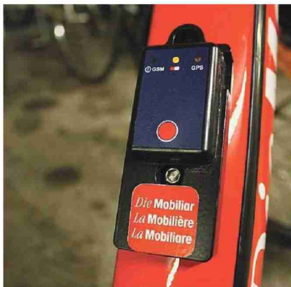
Testsender, der für den Versicherer Mobiliar entwickelt wurde.

Themen-Nr.: 650.4 Abo-Nr.: 1077154 Seite: 17 Fläche: 88'244 mm 2